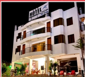
Hotel "Samay Wasi" (Chalhuancia)