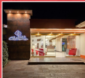
Hotel Club "Cusco" (Cusco)