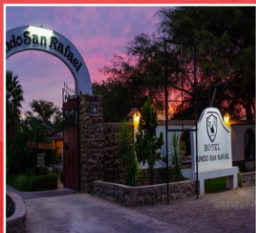
Hotel "Fundo San Rafael" (Nazca)